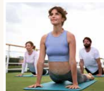
Ernährung & Yoga