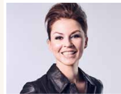
Rich & Famous